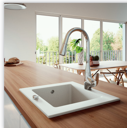
Genova VerdeLine – bateria zlewozmywakowa stojąca z wysuwaną wylewką. Wygodna w użytkowaniu i dekoracyjna jest interesującą propozycją baterii na kuchenną wyspę. Wysoka obrotowa wylewka oraz praktyczny natrysk o 2 strumieniach zapewniają optymalną pracę, bez narażenia na uszkodzenie zmywanych naczyń. Posiada regulator ceramiczny z systemem kontroli ciepłej wody.