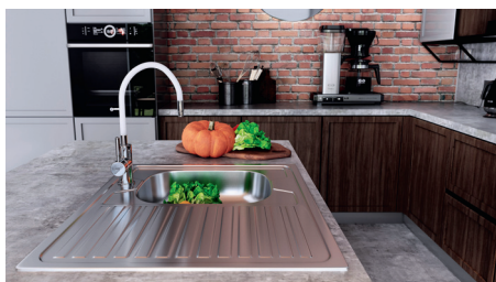
Zumba – bateria zlewozmywakowa stojąca z elastyczną wylewką

Zestaw wyposażony w metalową deszczownię o średnicy 30 cm z charakterystycznym mocowaniem do ściany zintegrowanym z jej ramieniem, termostatyczną baterią natryskową i 3-funkcyjny natrysk ręczny.