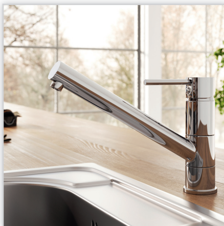
Fiesta – bateria zlewozmywakowa stojąca. Bateria o nowoczesnym designie świetnie prezentująca się w różnych aranżacjach. Wyróżnia ją wyraźnie skierowana ku górze obrotowa wylewka, pozwalająca na swobodne napełnienie nawet wysokiego naczynia. Wyposażona w regulator ceramiczny i pokryta chromowaną powłoką.