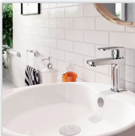
Alba VerdeLine – bateria umywalkowa stojąca. Jednouchwytywa bateria oszczędzająca wodę. Wyposażona w regulator ceramiczny, korek spustowy klik-klak G5/4, perlator. Posiada system łatwego usuwania kamienia wapiennego. Pokryta elegancką chromowaną powłoką.