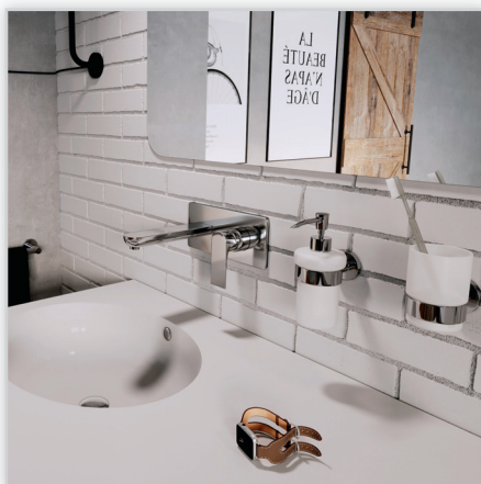
Algeo Square – bateria umywalkowa podtynkowa, wylewka 18 cm. Nowoczesna bateria umywalkowa podtynkowa o eleganckiej formie łączącej motyw prostokąta z łagodną, opływową linią i ergonomicznej idealnie płaskiej rączce uchwyty. Wyposażona w wylewkę o długości 18 cm z perlatozem oraz regulator ceramiczny.