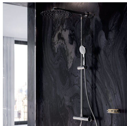
Trevi – deszczownia z natryskiem i baterią termostatyczną

Bateria wyposażona w regulator ceramiczny, automatyczny przełącznik wanna-natrysk, regulator strumienia, metalową rączkę natrysku, wąż w oplocie metalowym i podłogowy komplet przyłączeniowy. Doskonale zaprezentuje się w luksusowym pokoju kąpielowym.