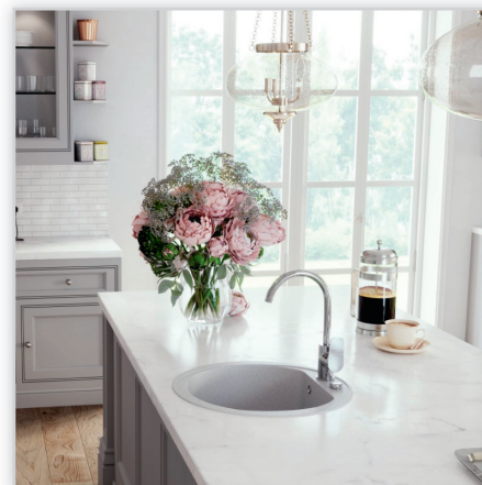
Tiga VerdeLine – bateria zlewozmywakowa stojąca. Należy do bogatej kolekcji baterii oszczędzających wodę przeznaczonych do łazienek i kuchni. Baterie wyróżnia okrągła forma korpusów i wylewek oraz płaskie idealnie komponujące się z nimi uchwyty. Bateria zlewozmywakowa posiada praktyczną obrotową wylewkę, regulator ceramiczny oraz perlator z systemem łatwego usuwania kamienia wapiennego.