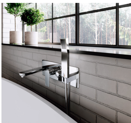
Algeo Square – bateria wannowa podtynkowa ścienna

Nowoczesna bateria wannowa podtynkowa z natryskiem punktowym. Wyposażona w regulator ceramiczny, ceramiczny przełącznik wanna/natrysk oraz wylewkę 19 cm z perlatorem.