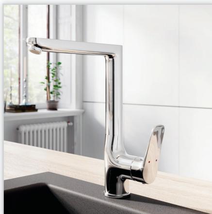
Espacio – bateria zlewozmywakowa stojąca. Bateria zlewozmywakowa stojąca z obrotową wylewką o długim zasięgu, która umożliwi komfortowe mycie naczyń. Jej ramię zamiast tradycyjnego łuku jest zgięte pod kątem prostym i dzięki temu bateria oprócz praktycznych zalet wyróżnia się także interesującym wzornictwem. Wyposażona w regulator ceramiczny i pokryta chromowaną powłoką.