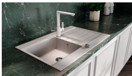
Adore – bateria zlewozmywakowa stojąca

Oferowana z wylewkami w kilku kolorach. Wysokość wylewki można ustawić w zakresie 280-440 mm, a jej zasięg od 150 do 350 mm. Można ją wymienić na inny kolor, gdyż wylewki są również oferowane oddzielnie, w blisterach. Wyposażona w regulator ceramiczny i regulator strumienia.