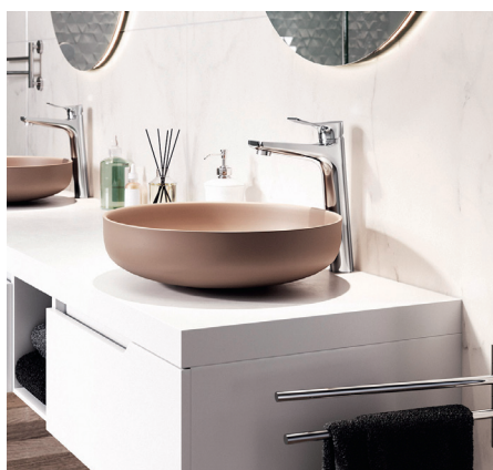
Espacio – bateria umywalkowa stojąca nablatowa

Nowoczesna bateria wannowa podtynkowa z natryskiem punktowym. Wyposażona w regulator ceramiczny, ceramiczny przełącznik wanna/natrysk oraz wylewkę 19 cm z perlatorem.