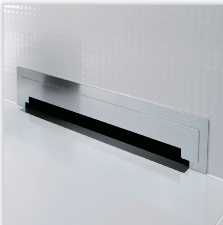
Wall slim – odpływ ścienny. Wykonany został z wysokiej jakości stali nierdzewnej, szlifowanej ręcznie oraz polerowanej i wyposażony w kolnierz hydroizolacyjny. Posiada stalowy syfon zintegrowany z otworem rewizyjnym, korek rewizyjny, który umożliwi łatwy dostęp do syfonu oraz polerowaną maskownicę.