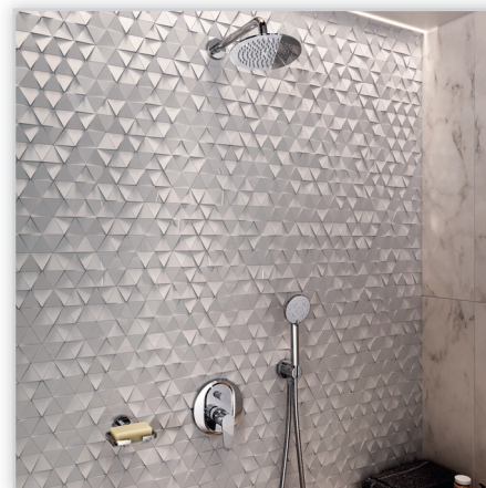
Algeo Set – kompletny zestaw podtynkowy z baterią i deszczownicą. W skład zestawu wchodzi: bateria podtynkowa, przyłącze kątowe z uchwytem na rączkę natryskową, okrągła deszczownica z ramieniem, wąż natryskowy i rączka natryskowa z trzema rodzajami strumienia (deszcz, masaż, mieszany). Bateria podtynkowa 2-funkcyjna z funkcją Anti-Stop wyposażona została w regulator ceramiczny i w metalową owalną maskownicę.