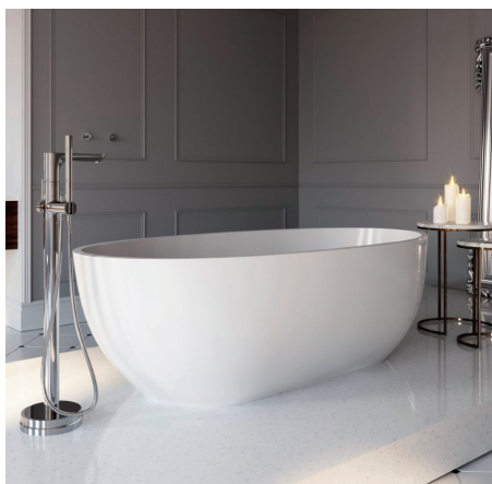
Fiesta – bateria wannowa wolnostojąca

Elegancka bateria do nowoczesnych łazienek. Wyposażona w regulator ceramiczny i regulator strumienia. Pokryta chromowaną powłoką.